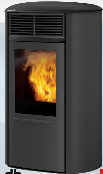
Aris Up2 8,2 kW*