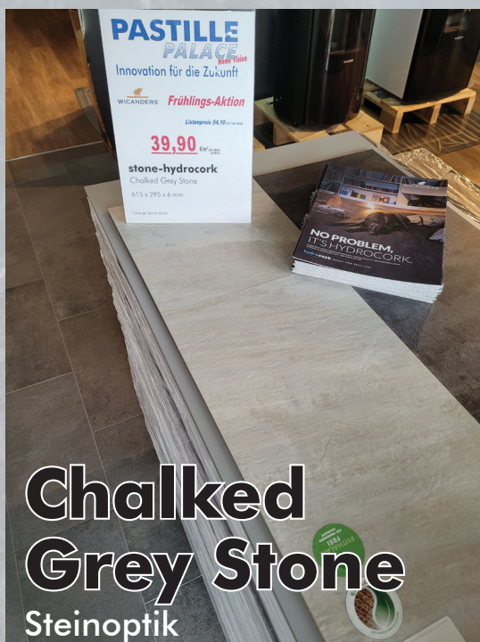
Chalked Grey Stone Steinoptik

Ohne V-Nut. Veredelt mit einer verschleißfesten Vinyl-Deck- schicht. Geeignet für Fußbodenheizung. Ausgestattet mit einem Klicksystem