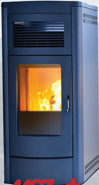
MUSA 15 kW Hydro**