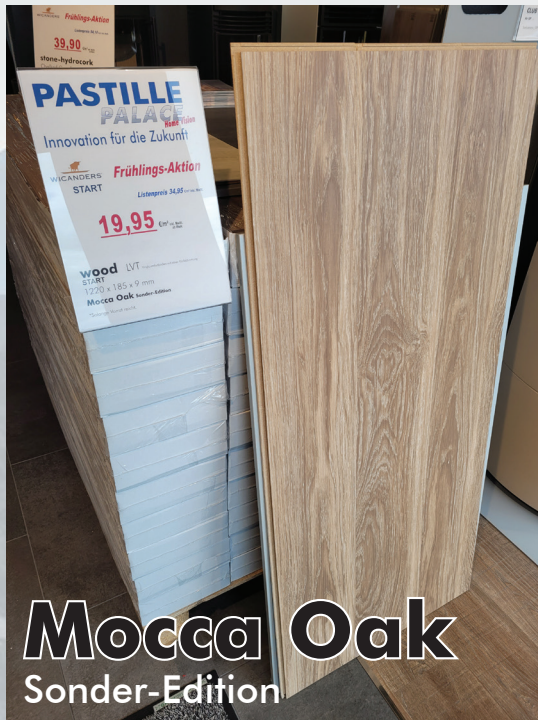
Mocca Oak Sonder-Edition