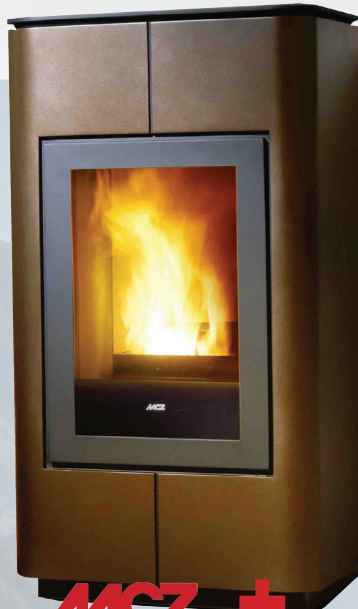
TRAY Natural 8kW*