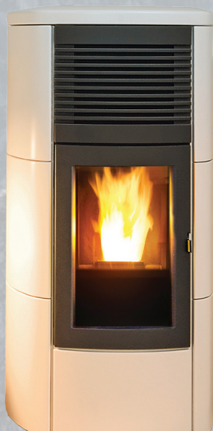
CLUB Comfort Air 12kW*